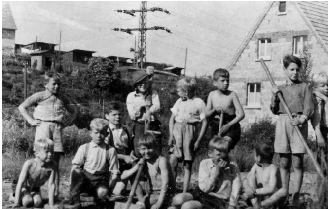
Zeitdokument: Kinder aus dem Jugenddorf „Heimatfreude“ bei der Gartenarbeit, vermutlich Mitte der 1960er Jahre.

15 ehemalige Heimkinder, die zwischen den Jahren 1950 bis 1970 in Einrichtungen des damaligen Hephatas lebten, haben in den vergangenen zehn Monaten teilweise massive Vorwürfe gegen die damalige Heimerziehung erhoben. Die Vorwürfe umfassen Gewalt als Mittel zur Erziehung, in Form von Schlägen und Einsperren. In sechs Fällen aber auch in Form von - auch für die damalige Erziehungspraxis indiskutabler - körperlicher und sexueller Gewalt. In einem Pressegespräch am 5. Juli nahmen der Vorstand der Hephata Diakonie und der Diakonischen Gemeinschaft Hephata dazu Stellung.