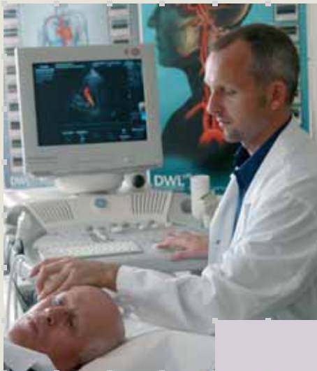
Entspannte Atmosphäre während der Sonografie