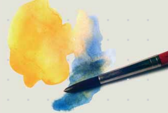
Ergotherapie in kleiner Gruppe