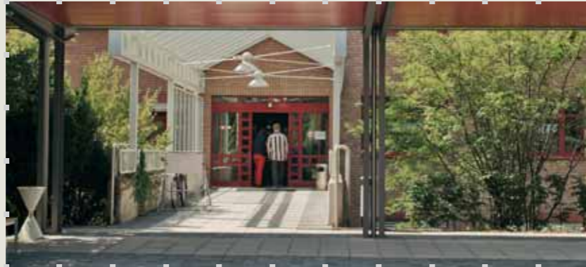
Eingangsbereich der Hephata-Klinik