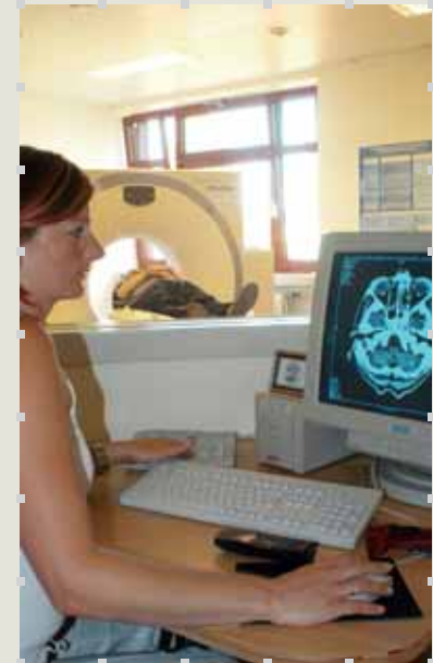
Moderne Technik in der Computertomografie