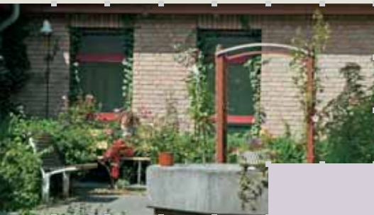
Ruhezonen im Grünen