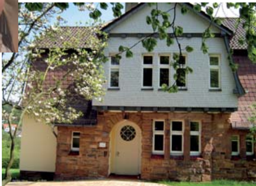
Villa Hephata: In diesem Gebäude sollen Menschen mit Prader-Willi-Syndrom in Zukunft zu Hause sein.